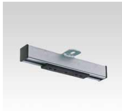
Скользящая опора M10