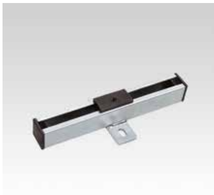
Скользящая опора M8