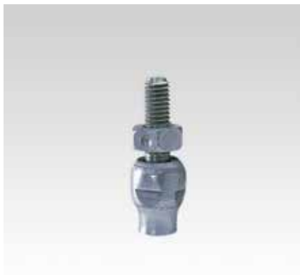
Маятниковая подвесная опора, короткая