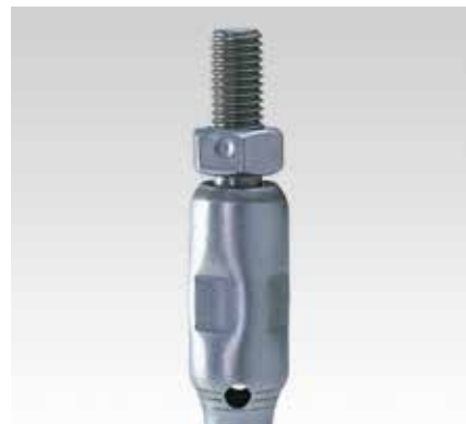
Маятниковая подвесная опора, длинная