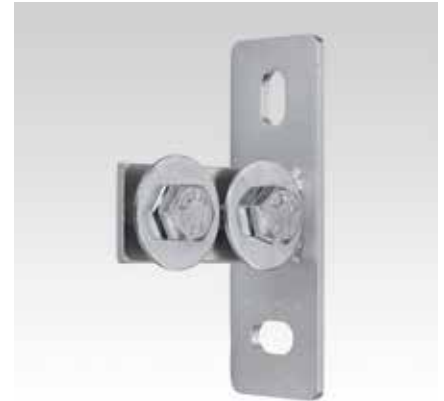
MPC-Торцовый фланец, продольное исполнение