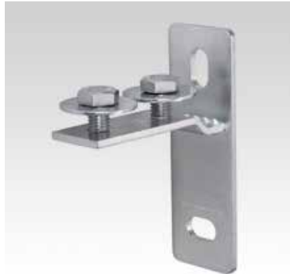
MPC-Торцовый фланец, поперечное исполнение