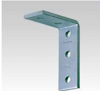
Угол монтажа 90°