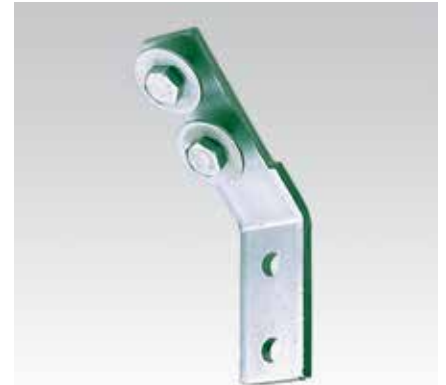
Угол монтажа 45°