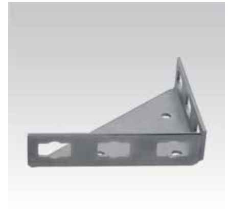
MPR-косынка типа S 195 x 195