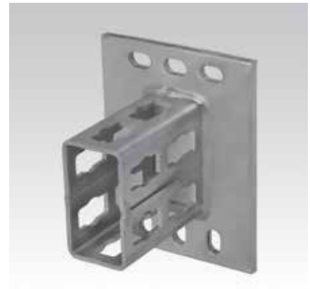
MPR-Седлообразные фланцы тип S, для профиля 41/82 и 41/124