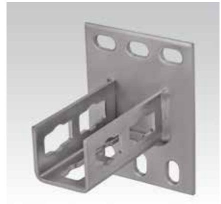
MPR-Седлообразные фланцы тип S, для профиля 41/41