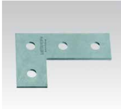
L-образные соединительные уголки