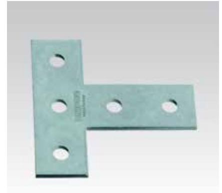
T-образные соединительные уголки