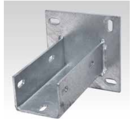
Для профиля Q100