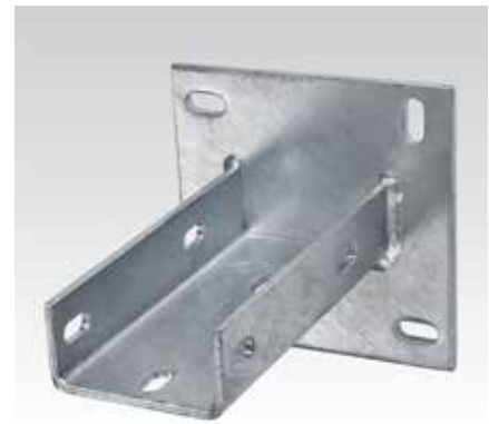
Для профиля Q50