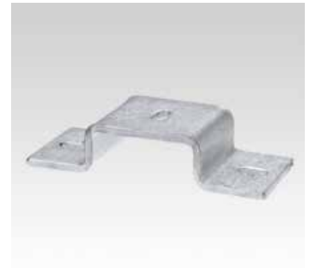
Скоба монтажного профиля MPT Q50