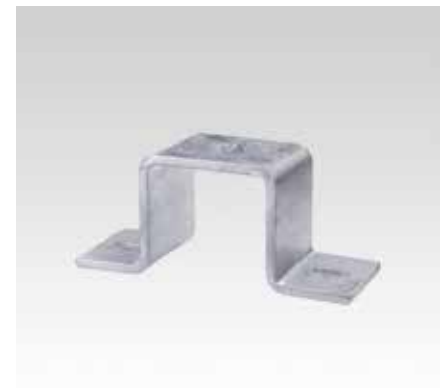
Скоба монтажного профиля MPT Q100